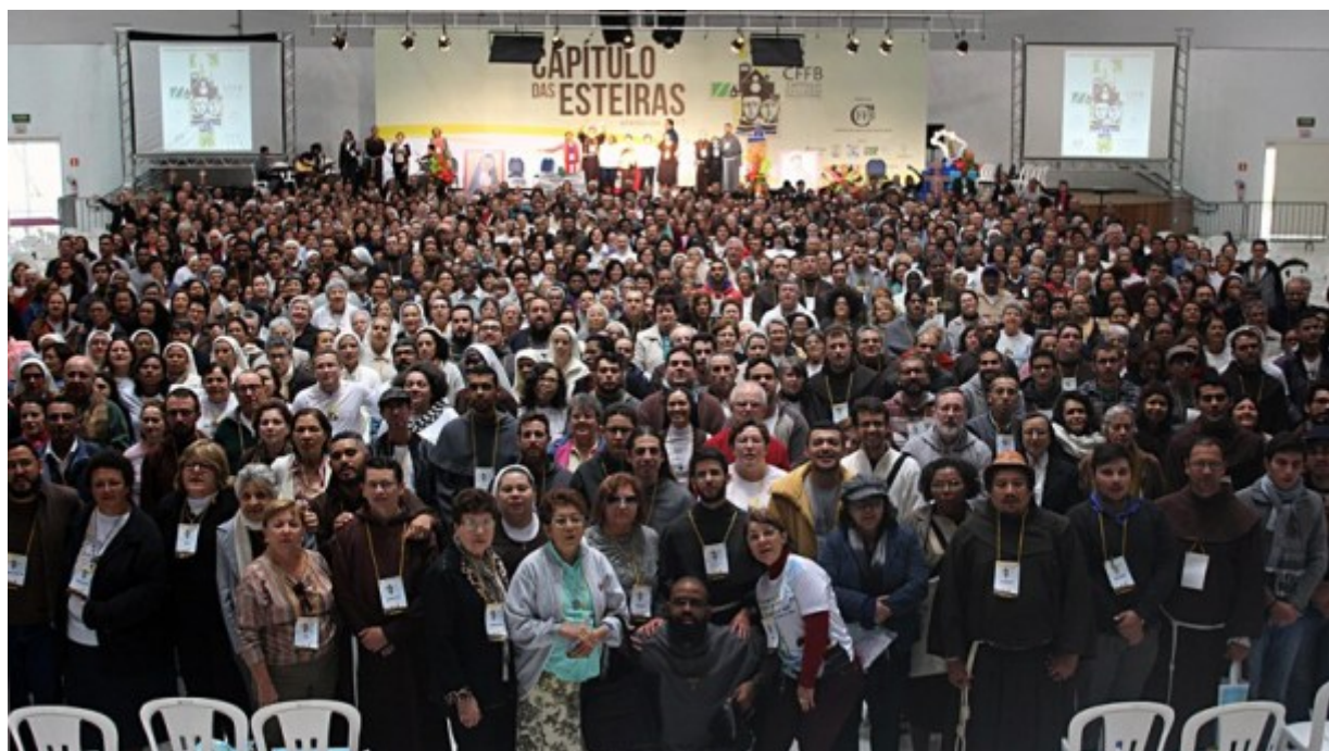
Franciscanos e franciscana no Capítulo Nacional das Esteiras, em Aparecida.

Um encontro histórico dos franciscanos e franciscanas de todo o Brasil proclamou em carta aprovada por unanimidade neste domingo (6) a adesão incondicional ao papado de Francisco e definiu como missão: “participar da reconstrução da Igreja com o Papa Francisco e reconstruir o Brasil em ruínas”. Trata-se de uma citação de um dos momentos mais conhecidos e cruciais da trajetória de São Francisco que, em 1205, na abandonada igreja de São Damião, em Assis, ao contemplar um crucifixo ouviu o que lhe parece uma mensagem direta: “Não vês como está a minha Igreja? Está em ruínas. Vai, e reconstrói a minha Igreja”. O mantra do encontro, repetido por quase todos os palestrantes e nas homilias durante as missas foi: voltar a Assis –retomar o espírito original de São Francisco.